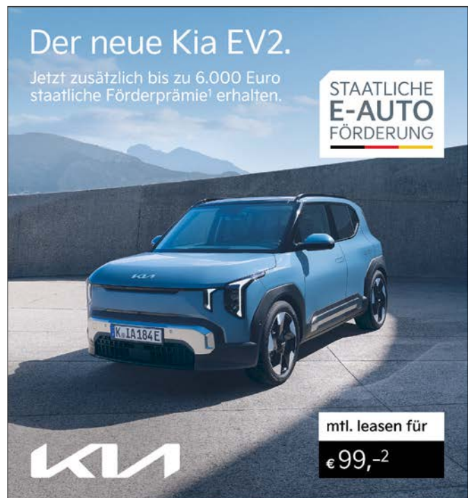
Abbildung zeigt kostenpflichtige Sonderausstattung.

Du willst elektrisch fahren? Der Kia EV2 macht dir den Einstieg einfach. Kompakt, effizient und mit durchdachtem Raumkonzept bietet er alles, was du brauchst - bis zu 453 km Reichweite 3 , 403 Litern Kofferraumvolumen und intuitive Konnektivität. Entdecke jetzt, wie unkompliziert Elektromobilität sein kann. Komm vorbei für deine erste Probefahrt bei uns und sichere dir zusätzlich bis zu 6.000 Euro staatliche Förderprämie 1 .