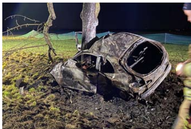
Bei einem schweren Verkehrsunfall auf der B7 kam eine Person ums Leben.

Natürlich auch im neuen Jahr wieder im Einsatzspektrum vertreten: automatische Brandmeldeanlagen, die die Kräfte auf Trab halten. Die erste in diesem Jahr löste am 12. Januar aus. Ein Eingreifen der Feuerwehr war nicht nötig – Fehlalarm.