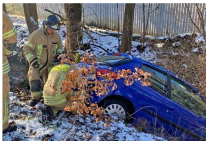
In der Sommeritzer Straße war ein PKW in die Limpitz gefahren.

Für die Beweissicherungsmaßnahmen der Polizei wurde durch die Feuerwehr die Unfallstelle ausgeleuchtet. Auch ein Hubschrauber kam für die Unfallaufnahme zum Einsatz. Die Aufgaben der Feuerwehr beschränkten sich im Weiteren auf die Absicherung und Beräumung der Einsatzstelle. Nach rund drei Stunden konnte der Einsatz beendet werden.