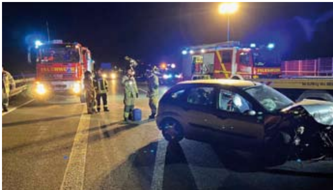
In der Nacht vom 27. auf den 28. August 2022 verunfallt ein PKW auf der Autobahn

Am 11. des Monats ereignete sich erneut ein Verkehrsunfall auf der Autobahn. Gegen kurz nach 13:00 Uhr kollidierten aus noch ungeklärter Ursache zwei PKW miteinander. Jeweils zwei Insassen befanden sich in jedem Fahrzeug, darunter auch ein Kind. Glücklicherweise blieb es auch hierbei nur bei Blechschaden. Zwei Patienten, darunter das Kind, wurden vorsichtshalber in das Altenburger Klinikum eingeliefert. Für die Feuerwehr bestand derweil außer der Absicherung der Einsatzstelle kein Handlungsbedarf.