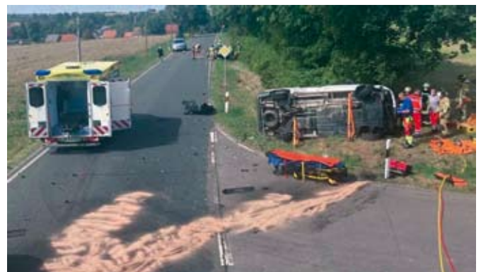
Bei Gimmel kollidierten ein PKW und ein Transporter. Drei Personen wurden verletzt und teilweise eingeklemmt, darunter auch ein Kind

Nur zwei Tage später, am 29. August 2022 gab es allerdings kein so glückliches Ende. Zwischen Altkirchen und Gimmel kollidierten gegen 13:40 Uhr ein PKW und ein Transporter miteinander. Durch den heftigen Aufprall wurden sowohl der Transporter-Fahrer als auch die PKW-Fahrerin in ihren Fahrzeugen eingeklemmt. Ein ebenfalls im PKW mitfahrendes Kind wurde glücklicherweise nicht eingeklemmt. Während die Kräfte aus Altkirchen den Fahrer des Transporters aus seiner Zwangslage befreien konnten, indem sie die Windschutzscheibe zersägten, mussten die Kameraden der Hauptwache mit hydraulischem Rettungsgerät eine Tür am PKW entfernen, um die Fahrerin zu retten. Alle drei Patienten wurden vorsichtshalber in das Klinikum Altenburg verbracht.