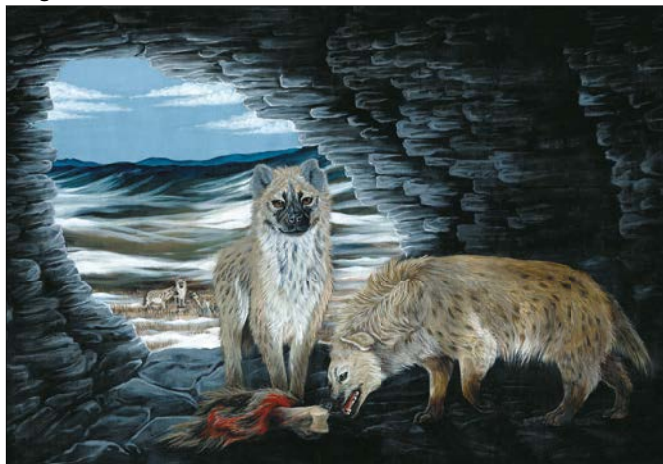
(Foto: Gemälde „Höhlenhyänen in der Lindenthaler Hyänenhöhle“ / Lilli Gerlach / Wien (2024))

nen Zähnen befand. Viele davon konnten zahlreichen Individuen der Höhlenhyäne zugeordnet werden. Die Tiere nutzten während der Weichsel-Kaltzeit über Jahrtausende den Schutz der Höhle, um darin ungestört ihre Beute zu fressen und um ihre Jungen aufzuziehen. So füllte sich die Höhle mit Knochenresten von über 30 Tierarten. Im Höhleninneren überdauerten die Fossilien besonders gut geschützt. Einzelheiten zur Entdeckungsgeschichte der Höhle, Informationen zu den Fossilien und erstaunliche neuere Erkenntnisse im Ergebnis genetischer Untersuchungen werden im reich bebilderten Vortrag lebhaft vorgestellt.