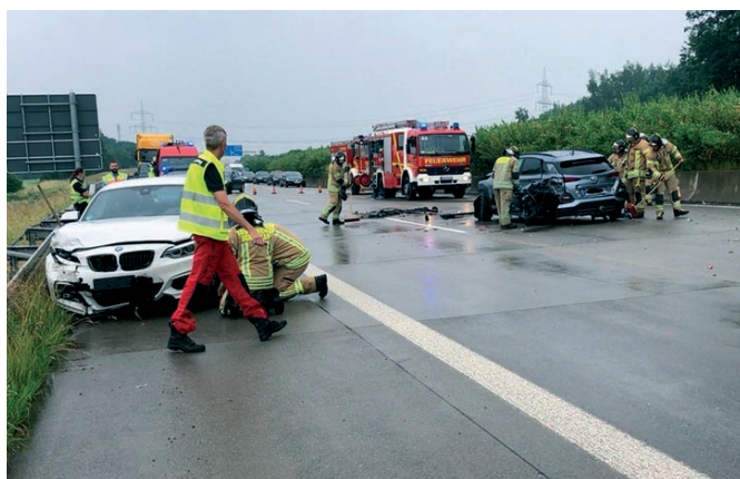
Vier Verletzte sind die Bilanz eines Unfalls auf der Autobahn

Zu einem schweren Verkehrsunfall kam es am Freitag Nachmittag, dem 25. Juni 2021, auf der Bundesautobahn 4 in Richtung Frankfurt. Zunächst waren dabei zwei Fahrzeuge kollidiert. Infolgedessen staute sich der Verkehr an der Unfallstelle. Ein PKW-Fahrer übersah die Gefahrenstelle und fuhr in die Unfallstelle. Durch diesen Folgeunfall wurde ein Beteiligter, welcher gerade noch etwas aus seinem Fahrzeug holen wollte, zwischen Fahrertür und B-Säule eingeklemmt und schwer verletzt, drei weitere Personen leicht. Aufgrund der unklaren Lage und der anfangs bereits hohen Anzahl an Verletzten wurden neben der Schmöllner Feuerwehr auch vier Rettungswagen, ein bodengebundener Notarzt und ein Hubschrauber zur Einsatzstelle entsandt. Ebenfalls alarmiert wurde der organisatorische Leiter Rettungsdienst sowie der Führungsdienst des Rettungsdienstzweckverbandes.