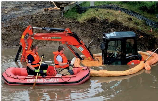
In einer Baustelle an der Eisenbahnlinie wurde ein Minibagger unter Wasser gesetzt.

Doch auch in Schmölln sollte der Starkregen zu einem Einsatz führen. Allerdings wurde der Einsatz erst am nächsten Vormittag entdeckt. In der Baustelle an der Eisenbahnlinie stand das Loch für neue Bahnbrücke unter Wasser. In dem Loch ein Minibagger, welcher fast komplett im Wasser stand. Aus diesem trat in der Folge Diesel aus. Der ausgelaufene Diesel wurde mit speziellem Bindemittel gebunden, die betroffenen Gewässer Limpitz und Sprotte wurden kontrolliert und eine Ölsperre wurde gesetzt. Nach rund einer Stunde war der Einsatz beendet.