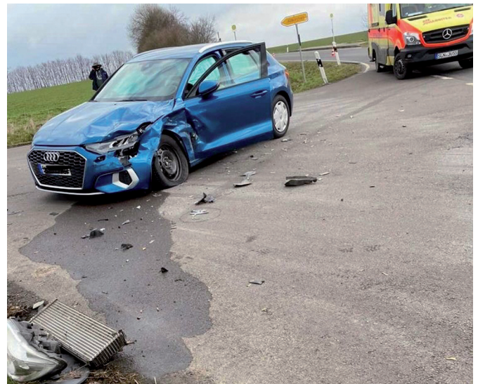
Bei einem Unfall am 22. März 2021 wurden zwei Personen leicht verletzt.

Am 22. März 2021 wurde die Wehr aus Altkirchen zu einem Verkehrsunfall zwischen Trebula und Gimmel alarmiert. Hier waren ein Kleintransporter und ein PKW kollidiert. Ebenfalls im Einsatz waren der Stadtbrandmeister und zwei Rettungswagen. Zwei Personen wurden leicht verletzt ins Krankenhaus nach Altenburg gebracht. Nach der Aufnahme von auslaufenden Flüssigkeiten konnte die Einsatzstelle an die Polizei übergeben werden.