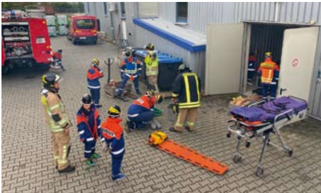
Bei der Übung bei HOT gilt es unter anderem eine eingeklemmte Person zu retten.

Nachdem sich alle bei Roster und Jagdwurst gestärkt hatten, ertönte dann erneut der Alarmgong. Dieses Mal ging es zu einer unbekanntenen Rauchentwicklung bei der Firma Containerdienst Seyfarth. Vor Ort stellte man fest, dass ein Holzhaufen brennt. Mit dem Schlauchwagen wurde zunächst eine lange Wegestrecke Schläuche verlegt. Danach wurde das Feuer mit mehreren Rohren bekämpft. Ein Mitarbeiter wurde mit Rauchgasinhalation von der Johanniter Unfall-Hilfe versorgt. Für den starken Einsatz belohnte die Firma Containerdienst Seyfarth die Kids und Ausbilder mit einer leckeren Bockwurst.