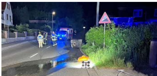
Auf der B7 in Großstöbnitz ist ein Container mit einer Bohremulsion auf die Fahrbahn gefallen und Leck geschlagen.

Zur Straßenreinigung kam im weiteren Verlauf auch die Kehrmaschine des Bauhofes zum Einsatz. Ebenfalls im Einsatz die Feuerwehr Großstöbnitz mit drei Fahrzeugen, die Kräfte aus Schmölln mit dem Gefahrgutzug bestehend aus vier Fahrzeugen, das Havarieteam der Stadtwerke sowie ein Rettungswagen. Zur Havarie-Ursache hat die Polizei noch in der Nacht die Ermittlungen aufgenommen. Während der Bergungs- und Reinigungsarbeiten war die B 7 am Abzweig Altkirchner Weg/Straße der Einheit voll gesperrt. Nach rund zweieinhalb Stunden konnten die Kräfte den Einsatz beenden.