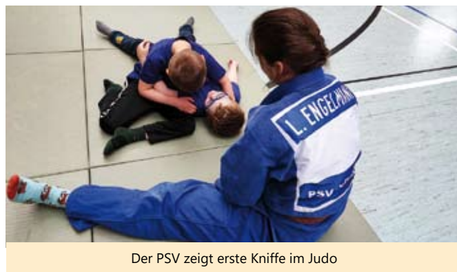
Der PSV zeigt erste Kniffe im Judo

Im Mai waren wieder 18 Kitas mit insgesamt 200 Kindern in der Ostthüringenhalle zu Gast, um bei dieser Veranstaltung teilzunehmen. Gemeinsam wurde gespielt, geturnt, getobt und Geschicklichkeit trainiert. An erster Stelle stand natürlich der Spaß. Ehrgeiz spielte allerdings auch eine kleine Rolle, denn am Ende der Veranstaltung werden immer die 10 Besten aus jeder Kategorie geehrt.