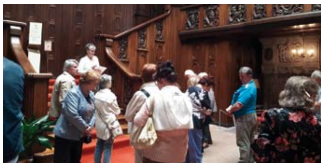
Bildersuchfahrt des MC Schmölln nach Waldenburg mit Schloss und Porzellanmuseum