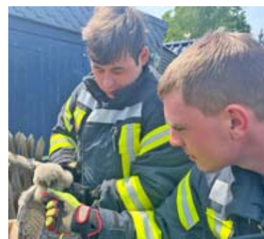
Kräfte der Feuerwehr Großstörnitz bei der Rettung einer Waldohreule

In Großstörnitz fiel am folgenden Samstag eine junge Waldohreule aus ihrem Nest. Mit Hilfe der Drehleiter wurde das Jungtier zurück ins Nest gesetzt. Am nächsten Tag der gleiche Einsatz noch einmal. Diesmal wurde der Freigänger in eine Auffangstation nach Rositz verbracht.