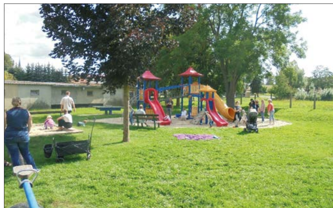
Das Team der „Altkirchner Landknöpfe“

An einem Augustnachmittag trafen sich Groß und Klein erneut zum gemeinsamen Nachmittag auf dem Dorfkernspielplatz. Beim Picknick kamen Familien der „Altkirchner Landknöpfe“ und eine Pädagogin des Teams ins Gespräch. In lockerer Atmosphäre hatten alle schöne Gespräche und lernten sich noch besser kennen. Zum ersten Mal waren auch einige Eltern der ehemaligen Kita „Rosengarten“ dabei. Die Kinder tobten sich bei schönstem Wetter auf den Spielgeräten und der großen Wiese aus. Wir waren uns einig: Dieser Nachmittag wird ein neues Ritual im Kitaalltag, das bald wiederholt werden soll! Auch weitere Angebote in der generationsübergreifenden Arbeit wie das Familiensportfest, ein Spielenachmittag oder eine Herbstwoche stehen in Aussicht. Wir freuen uns auf eine gemeinsame Zeit!