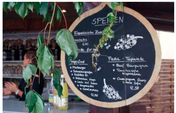
M. Itner, Stadtverwaltung Schmölln

Bitte bringen Sie eine Mund-Nasen-Bedeckung mit. Diese ist für die Nutzung der Toiletten sowie in den Warteschlangen notwendig. An Ihrem Platz dürfen Sie die Maske ablegen.