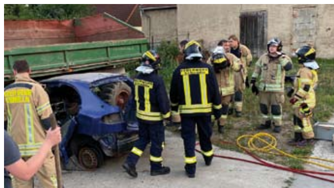
Beim Ausbildungsdienst am 28. Juli 2020 galt es eine verletzte Person aus einem Autowrack zu befreien

Am Abend des 20. Juli 2020 kam es im Stadtgebiet zu einem medizinischen Notfall. Da kein bodengebundener Notarzt verfügbar war, entsandte die Leitstelle in Gera einen Notarzt per Hubschrauber an die Einsatzstelle. Die Knopfstadtretter kamen zum Einsatz, um die Landung am Pfefferberg abzusichern und den Notarzt zur nahegelegenen Einsatzstelle zu befördern.