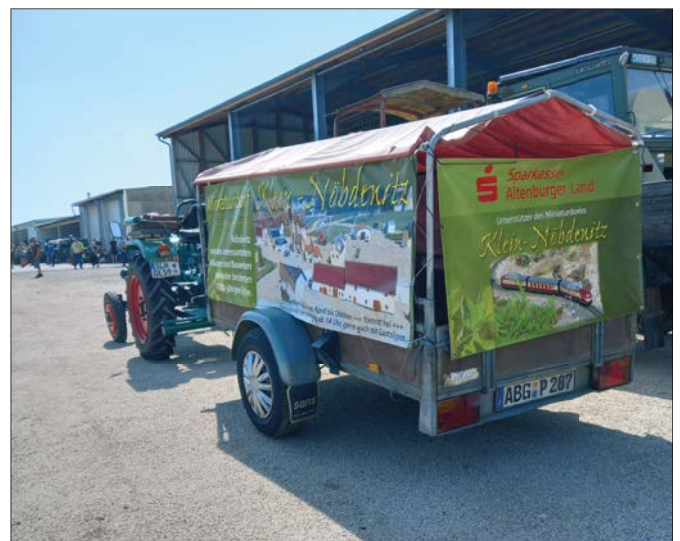
Freundeskreis Klein Nöbdenitz in Lohma

Interessenten können sich direkt an den Freundeskreis Klein Nöbdenitz oder auch per E-Mail an presse@schmoelln.de wenden. Ein Kontakt zum Freundeskreis wird dann hergestellt.