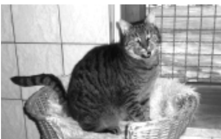
Text zum Bild - siehe oben! =>

Ich bin „Herkules“, ein 8-jähriger Schäferhund-Husky-Mix. Wenn Sie einen treuen, vierbeinigen Begleiter suchen, vielleicht auch für lange Spaziergänge, bin ich bestimmt der Richtige. Da ich von meinen ehemaligen Besitzern vernachlässigt und schließlich ins Tierheim abgeschoben wurde, wünsche ich mir endlich Familienanschluss in einem individuellen, liebevollen Zuhause. Außer, dass ich keine Katzen mag und Rüden nur bedingt nach Sympathie, bin ich freundlich, ausgeglichen und unkompliziert - ein richtiger Kumpel. Menschen, die es gut mit mir meinen, gewinnen meine vorbehaltlose Zuneigung und bekommen ein Vielfaches an Vertrauen und Liebe von mir zurück.