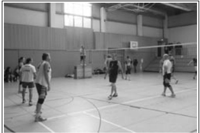
Statistik: VSV Gößnitz, Mixed Schmölln (Nitzschka), Prost Schmölln, Arminia Großstöbnitz, Lehrer Schmölln, SV Thonhausen, PSV Schmölln, SV Großstöbnitz, Thonhausen Mittwochslub, SV Ponitz, Fortschritt Schmölln, Hermes Gera

Komplettiert wurde die begehrte Endrunde erstmals durch die deutlich verjüngte und verbesserte Mannschaft des Mittwochslub aus Thonhausen.