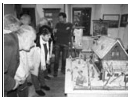
Spielzeug aus der Zeit der Großeltern stößt immer auf großes Interesse der Besucher.

Wie jedes Jahr in der Advents- und Weihnachtszeit lädt das Heimatmuseum Meerane zur Weihnachtsausstellung in das Alte Rathaus am Markt ein. Bereits die Eröffnung der Ausstellung am 25. November 2011 stieß auf großes Interesse. Bürger-