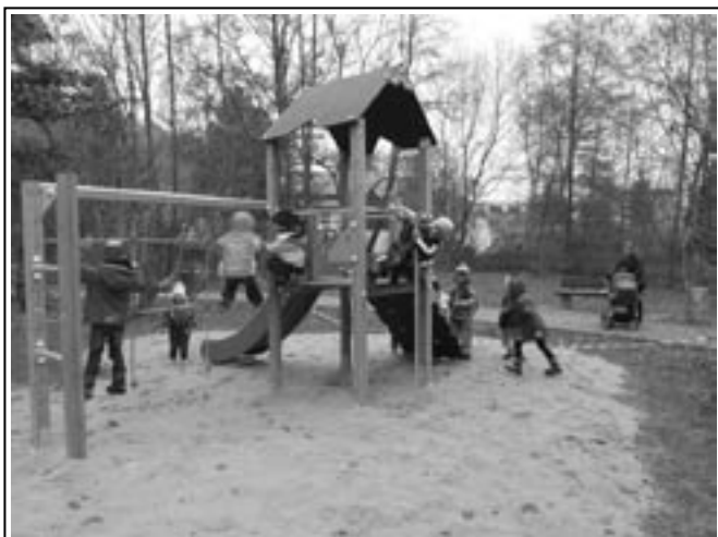
Eine Gruppe der Kita „Bummi“ testete als Erste die Qualitäten des Spielgerätes

Zu verdanken ist diese Neuanschaffung Volker Kutzner, der anlässlich seines runden Geburtstages fleißig Spendengelder sammelte und letztendlich über 3.000 Euro für das neue Spielgerät zur Verfügung stellte.