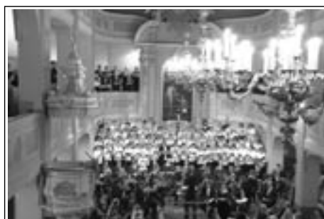
Die festlichen Konzerte in der Marienkirche sind fester Bestandteil der Werdauer Kulturlandschaft.

In der Stadt Werdau geht es in diesem Jahr in der Adventszeit besonders musikalisch zu. Das traditionelle Weihnachtskonzert wird am Montag, dem 12. Dezember, um 19:30 Uhr in der Marienkirche dargeboten.