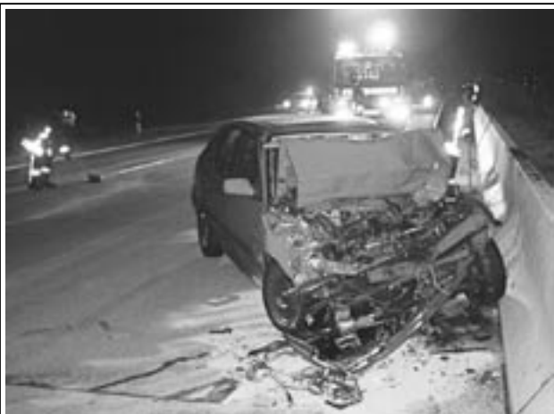
Bei diesem Unfall am 13.11.2011 auf der Bundesautobahn wurde eine Person verletzt.

Sechs Einsätze, so lautet die Bilanz des Monats November für die Kameraden der Freiwilligen Feuerwehr Stadt Schmölln. Neben einer angefahrenen, vermeintlich verletzten Katze, welche beim Eintreffen der Kameraden wieder rennen konnte, zwei Alarmen der Brandmeldeanlage im Freizeitbad Tatami sowie einer Nottüröffnung, bei der leider jede Hilfe zu spät kam, wurden die Kameraden auch auf die Bundesautobahn 4 zu einem Verkehrsunfall gerufen. Bei diesem war ein PKW durch Unachtsamkeit auf einen LKW aufgefahren und im weiteren Verlauf gegen die Betongleitwand geprallt.