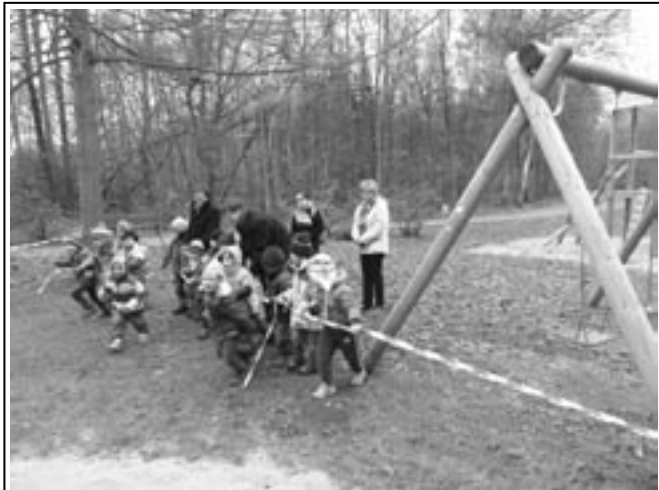
Das durchgeschnittene Band war der Startschuss für die „Eroberung“ des Spielgerätes

Über ein neues Spielgerät auf dem Spielplatz im Stadtpark dürfen sich unsere Kleinsten in Schmölln freuen. Besonders die Eltern, deren Kinder im Kindergartenalter sind, werden mit Erleichterung diese neue Spielmöglichkeit für ihre Sprösslinge registrieren. Denn obwohl Schmölln über inzwischen 20 öffentliche Spielplätze verfügt, muss festgestellt werden, dass das Angebot gerade für die Altersgruppe der 3- bis 6-Jährigen nicht gerade üppig ist.